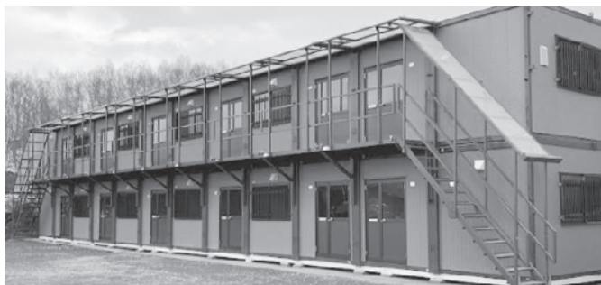
階段、踊り場(屋根付) 施工例