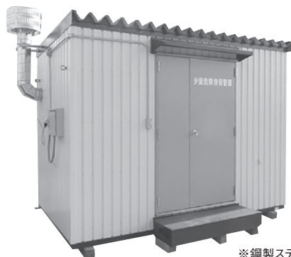
※鋼製ステップ、鋼製底はオプション装備です。