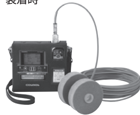
8mガス導入管 装着時

作業前の安全確認に 本体に8mのガス導入管とポンプ ユニットセットを使用して、作業前 の安全確認ができます。