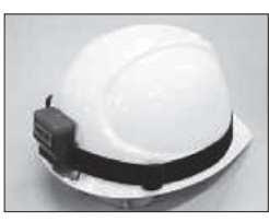
ヘルメットに小型軽量センサー装着、作業を妨げない。

道路工事中の作業員後方から、バックホウやローラー等がバックで接近した事を、重機後部に取り付けた「みはりセンサー」と作業員のヘルメット後頭部に取り付けた「ヘルセンサー」で感知し、音で作業員と運転席に危険を知らせる警報補助装置です。重機後部に取り付けた「みはりセンサー」の感知距離は、切替スイッチで5mと10mに切替出来ます。