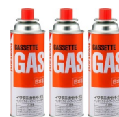
11 カセットガス × 3