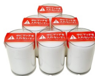
6 ロウソク × 6