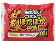
12 カイロ × 10