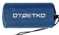
8 エアマット × 3