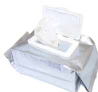
14 ウェットタオル × 2