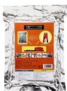
9 圧縮毛布 × 3