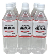
1 5年保存水 × 9