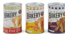
3 ソフトパン × 9