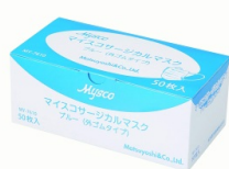
13 マスク × 50