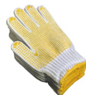
15 軍手 × 12