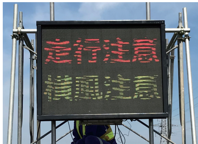
高精細タイプ 1台単体 (1,280 × 960mm)