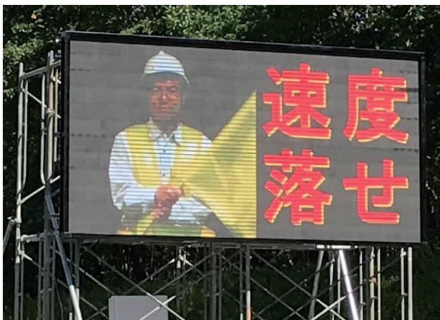
高精細タイプ 横3連結×縦2連結 (3,820 × 1,920mm)