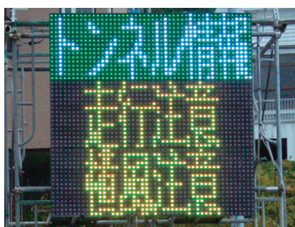
縦3連結 (1,920 × 1,920mm)