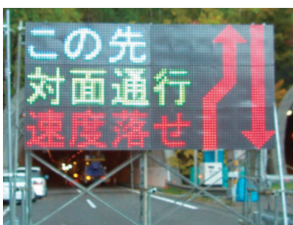
横2連結×縦3連結 (3,840 × 1,920mm)