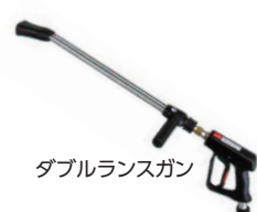
ダブルランスガン