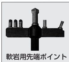
軟岩用先端ポイント