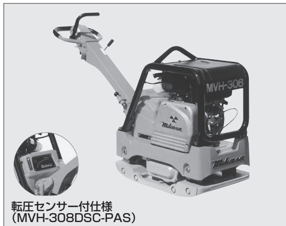
転圧センサー付仕様 (MVH-308DSC-PAS)