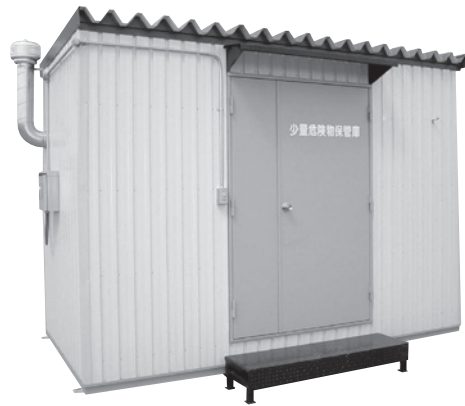
※鋼製ステップ、鋼製庇はオプション装備です。