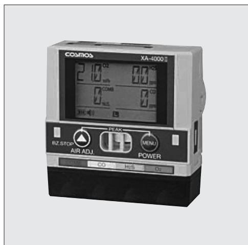
ポンプユニットセット PA-4000II