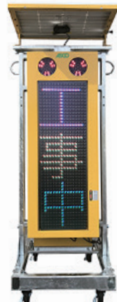
VIII SL フルカラー