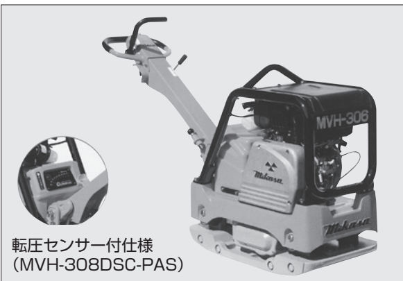
転圧センサー付仕様 (MVH-308DSC-PAS)