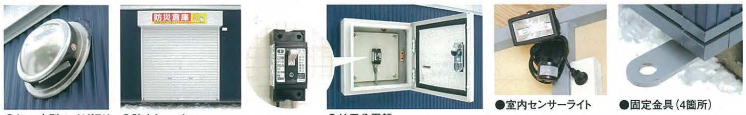
●φ100丸型フードガラリ (防火ダンパー付) ●防火シャッター ●外用分電盤 ●室内センサーライト ●固定金具 (4箇所)